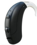
Vea 180 / 380

DEPARTAMENTO DE CONVENIOS: Tel. 5117-2620, 2623 y 2687 graciela.gonzalez@lux.mx convenios@lux.mx conven1@lux.mx