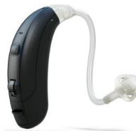
Veia 170 / 370