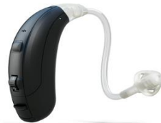
Vea 170 / 370

INCLUYEN MOLDE Ó TUBO, ASÍ COMO SESIONES DE MANTENIMIENTO Y AJUSTES SIN COSTO